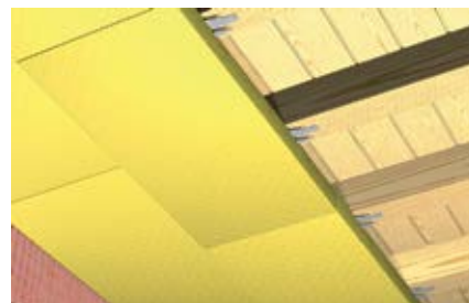
Прочные на сжатие термоизоляционные панели при креплении к потолку