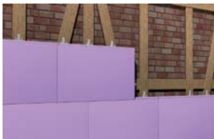
Прочные на сжатие термоизоляционные панели в деревянных подконструкциях