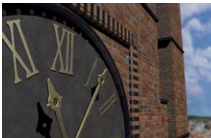
Ремонт наружных панелей