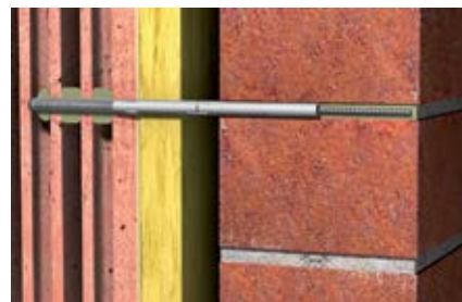
Фрагмент: Ремонт облицовки